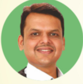
मा. ना. श्री. देवेंद्र फडणवीस मुख्यमंत्री, महाराष्ट्र राज्य