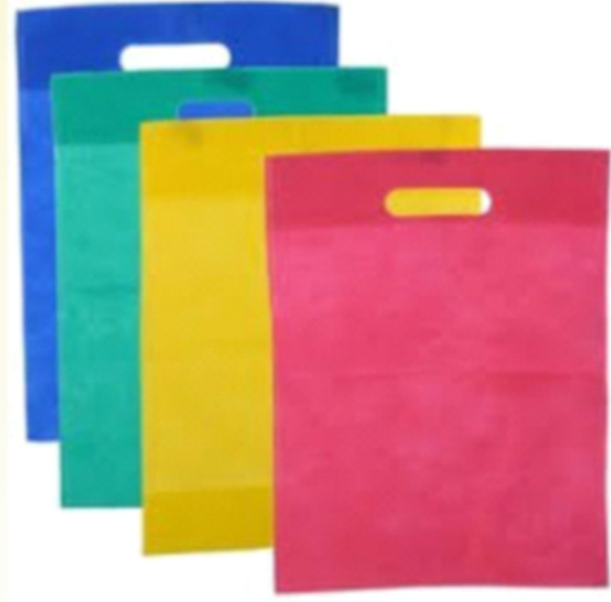
नॉन वोवन बॅग्ज (पॉलिप्रॉपीलीन)