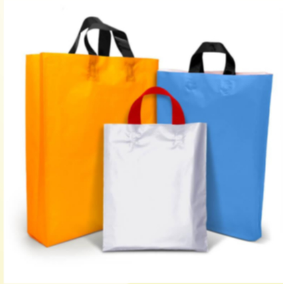
प्लास्टिक/नॉन वोवन शॉपिंग बॅग्ज